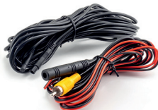
Anschlusskabel Set (AK-KC403)