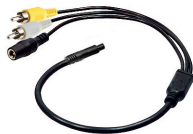
adapter cable (AK1011)