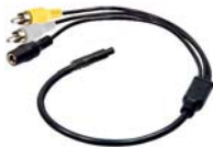
adapter cable (AK1014)