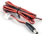
power cable (AK1001)