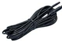
extension cable (AK1016)