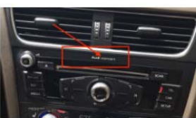
Audi Radio Concert oder Symphony