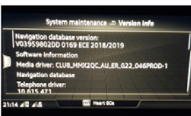
CLUB_XXXX = Audi MIB II High