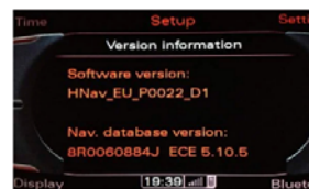
HNNav_XX = Audi MMI 3G High