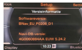
BNNav_XX = Audi MMI 3G Low/Basic