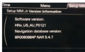
HN_XX = Audi MMI 3G+