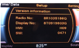
Audi Concert oder Symphony