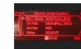
Audi MMI 2G Low/Basic mit monochromem Display und werden NICHT unterstützt!