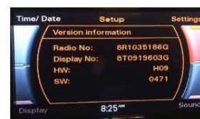
Audi Concert oder Symphony Versionsinformation im Menü