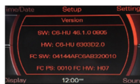
Audi MMI 2G High