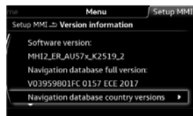
MHI2_XX = Audi MIB II