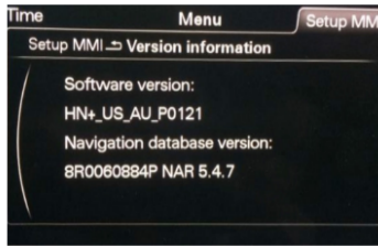
HN+_XX_ = Audi MMI 3G+