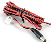
power cable (AK1001)