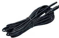
extension cable (AK1020)