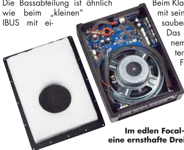
Im edlen Focal-Gehäuse befindet sich eine ernsthafte Dreikanalendstufe

Das ist erstklassiger Bass aus kleinem Gehäusevolumen. Mit unter 55 Hz Tiefgang punktet der Franzose auch bei Hörern, die einen ernsthaft tiefen Bass nachrüsten wollen. Auch angesichts des hohen Preises kann man nur sagen, dass die Leistung stimmt.